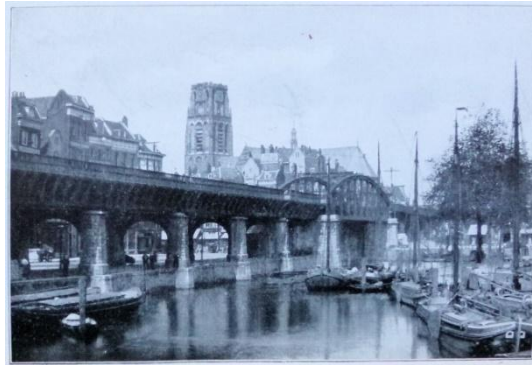
Afbeelding van de Laurenstoren bij Van der Ven (1916)

Krul had een gemengd repertoire gekozen, voor elk wat wils. Op het programma stonden volksliederen en wijsjes uit de populaire zangbundel “Kun je nog zingen?” Daarnaast speelde hij ook werk van componisten als Bach, Spoel, Pijzel, Zagwijn en Hullebroeck. Bij populaire wijsjes werd zacht meegezongen. De recensent van Het Centrum moedigde Krul daarom aan om bij een volgende gelegenheid vooral weer populaire vaderlandse liedjes te spelen. 8